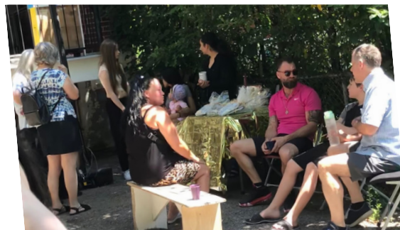
CÉLÉBRATION EN FIN D'ANNÉE SCOLAIRE