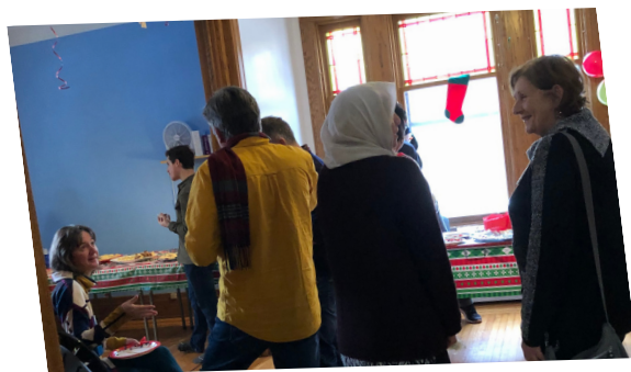
DÎNER DE NOËL

Des occasions pour l'équipe et les jeunes de remercier nos chers bénévoles et de passer des moments agréables avec eux